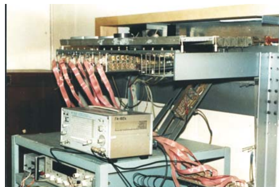
Лабораторный макет 8-канальной ЦАР

ра наук, был организатором и руководителем постоянно действующего семинара «Проблемные вопросы анализа и синтеза цифровых антенных решеток».